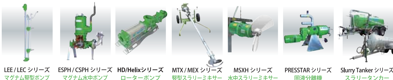
LEE/LEC シリーズ マグナム堅型ポンプ